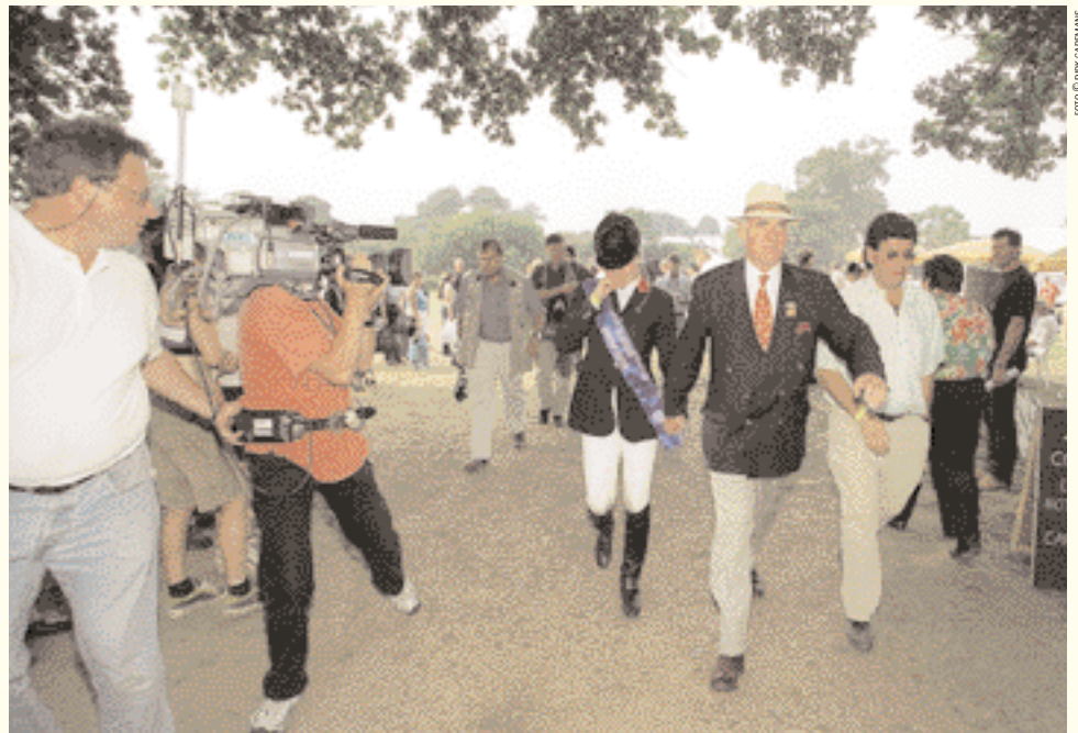
Alexandra Ledermann heeft de Europese titel gewonnen op het EK in Hickstead, en wordt op weg naar de persconferentie achtervolgd door de pers. Ook tv-camera's zijn present.

'Volgens het nieuws dat er in zit. Hoe moet ik dat formuleren? Als Ludo Philippaerts een medaille pakt op het Europees Kampioenschap in Arnhem, dan krijgt dat zijn plaats in het Nieuws. Het is niet omdat het paardensport is, dat het sowieso op rang zeven of zes terecht komt. Het kan