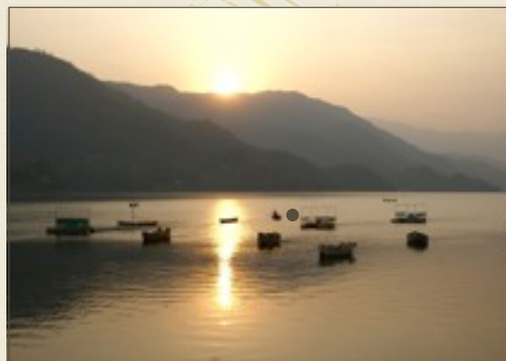
Lac Phewa à Pokhara

21/10 : Arrivée à Bruxelles à 7h55' du matin