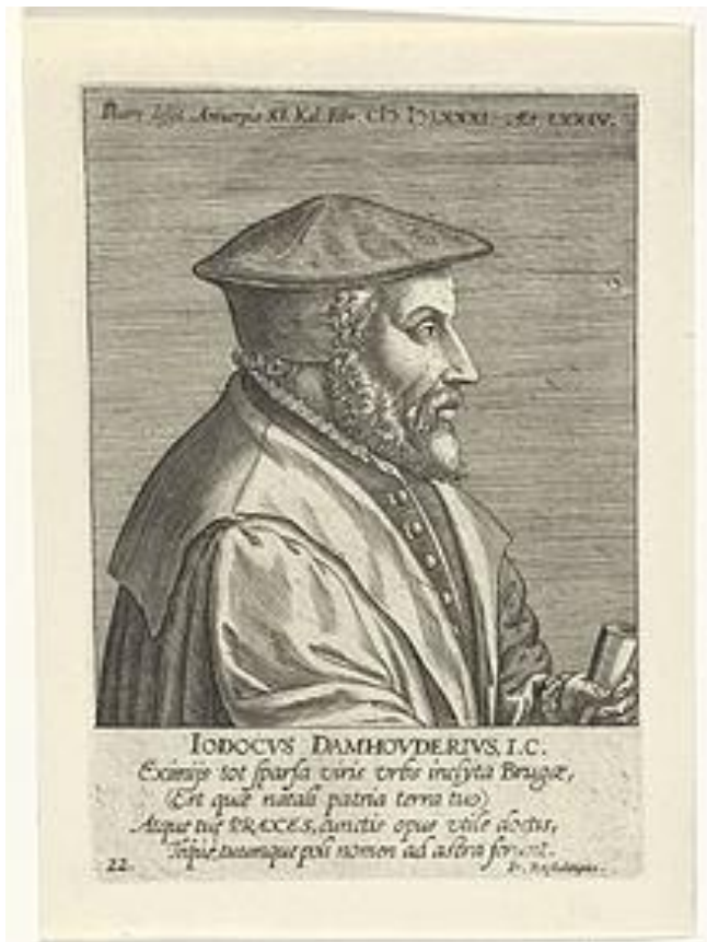
Joos de Damhouder (gravure van Philip Galle, 1604) ( https://en.wikipedia.org/wiki/Joos_de_Damhouder )

daarnaast waren er ook nog de rechtbanken van het Brugse Vrije (een kasselrijrechtbank voor het gebied rond Brugge) en de Proosdij (verbonden aan de Sint-Donaaskerk) die recht sprak in diverse heerlijkheden en wijken in en rond de stad.