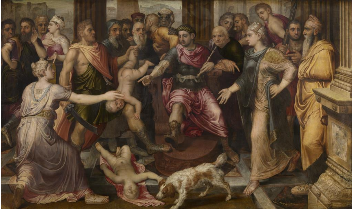
Het Oordeel van Koning Salomon van Frans Floris de Vriendt (Antwerpen, Museum voor Schone Kunsten)

Ook oudtestamentische rechtszaken waren een geliefkoosd thema. Bijzonder populair was natuurlijk het oordeel van de Joodse koning Salomon, hét voorbeeld van wijsheid en spitsvondigheid. Maar evenzeer is dit het geval met het oordeel over de kuise Suzanna, een bijbels thema dat voor schilders een dankbare gelegenheid was om vrouwelijk naakt te kunnen schilderen. Het apocrief verhaal van Suzanna was bijzonder inspirerend tijdens de 16 de -17 de eeuw omdat het enkele basisprincipes van goede rechtspraak illustreerde. Ter herinnering... twee oude mannen begluren de mooie Suzanna en maken seksuele avances. De jonge vrouw weigert daarop in te gaan, waarna de twee gluisperds de schuld in haar schoenen proberen te schuiven. Even lijkt het alsof Suzanna door de rechters wegens overspel ter dood veroordeeld zal worden. Maar als een deus ex machina verschijnt dan de profeet Daniel, die de oude heren weet te ontmaskeren door ze onafhankelijk van elkaar een tegenstrijdige verklaring te laten afleggen. Het exemplum van de kuise Suzanna vormde een richtlijn voor objectieve rechtspraak: een uitspraak kan niet gedaan worden op basis van loze beweringen, en iemand is onschuldig tot de feiten, na een fatsoenlijk onderzoek, het tegendeel bewijzen.