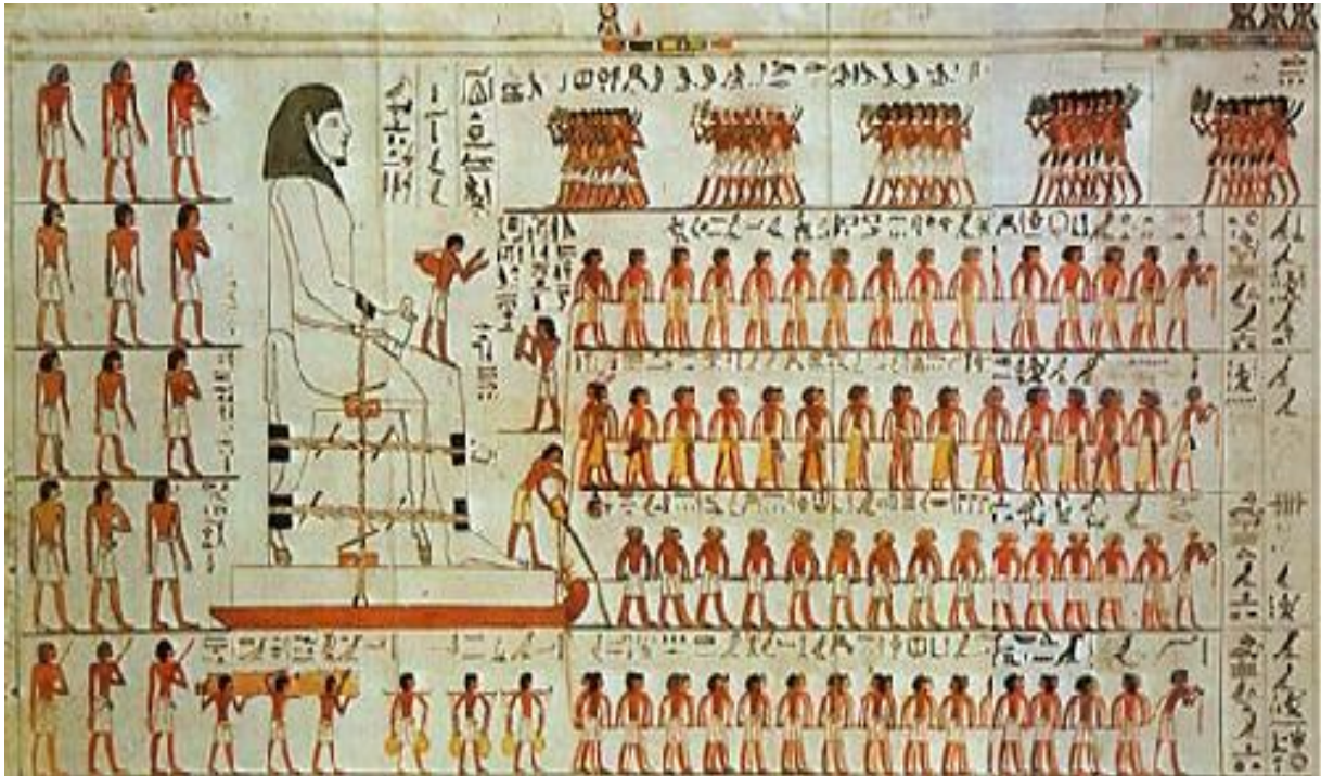
Muurschildering uit de tombe van Djehoetihotep