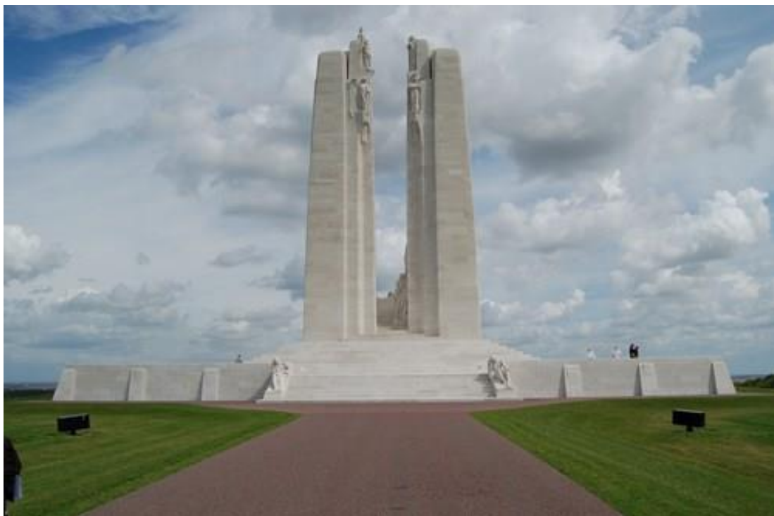
Het indrukwekkende Canada Memorial in Vimy