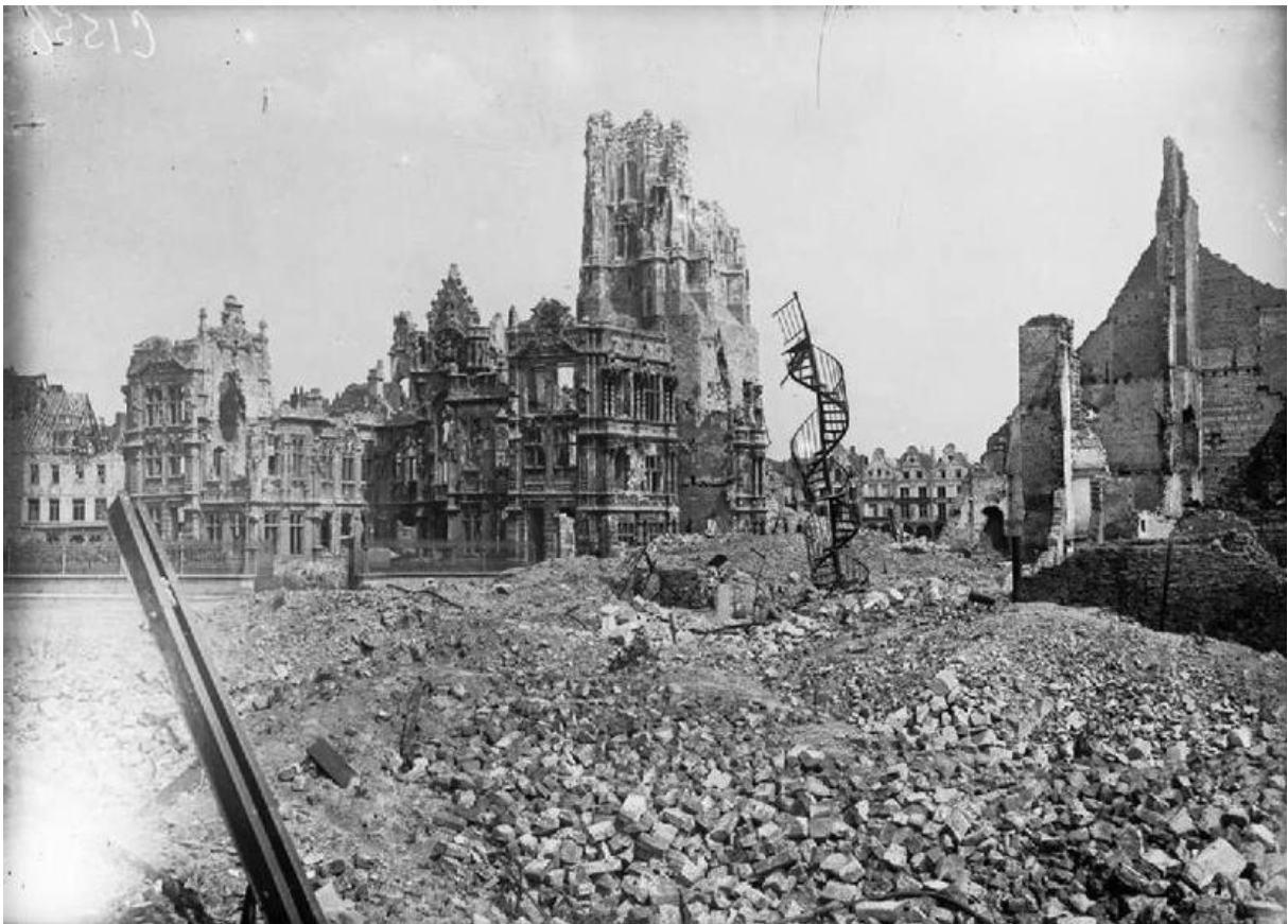
Het verwoeste Arras in 1918

In het mediageweld rond de Eerste Wereldoorlog is ‘aandacht’ soms een relatief begrip. Zo blijft het bijvoorbeeld over de militaire gebeurtenissen in Noord-Frankrijk vaak oorverdovend stil. Vooral het gebied tussen Armentières en Arras lijkt soms wel een ‘vergeten front’. Nochtans werd in het vroegere graafschap Artesië gedurende vier jaar een verbeterde strijd gevoerd. Post Factum wil aantonen dat de beperkte aandacht voor dit vergeten slagveld onterecht is. Ook hier ligt de streek immers bezaaid met merkwaardige herinneringen aan ‘14-18’. Begraafplaatsen, monumenten, tunnelcomplexen en ruïnekerken vertellen er elk hun eigen verhaal over de oorlog in Artois. Hier volgt reeds een voorsmaakje van de ‘eigen productie’ van Post Factum. Afspraak voor deze historische thematocht op 28 juni!