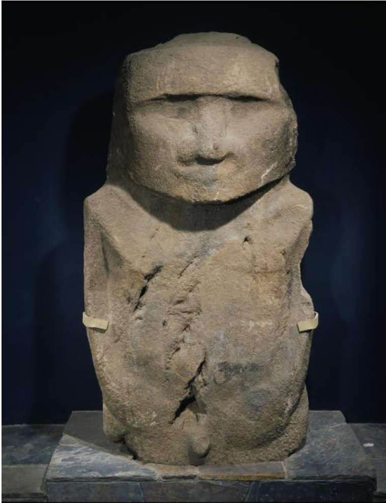
Standbeeld van Pou Hakanononga

Gebeurde de heenreis met een Frans schip, de terugreis zal met het Belgische schoolschip Mercator geschieden. De driemaster maakt in het najaar van 1934 de tocht van Antwerpen via het Panamakanaal naar Rapa Nui en komt daar aan op 12 december 1934. Het is de bedoeling dat er een heleboel voorwerpen meekomen naar Europa . Uiteindelijk kan men ook Pou Hakanononga of de god van de tonijnvissers op het dek van de Mercator takelen, waar het in zeildoek wordt ingekapseld voor de overtocht naar België.