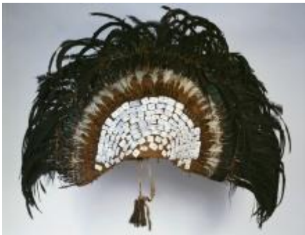
Waiervormige hoofdtooi van voor 1857

In Oceanië deden de inwoners niet aan 'kunst voor de kunst'. De meeste Oceanische (kunst)voorwerpen zijn gemaakt met een bepaald sociaal of religieus doel voor ogen door mensen die ingewijd waren in de kunst van het maken. Meester-kunstenaars maakten vaak ook deel uit van de heersende klasse omdat ze de juiste rituelen en regels kenden. Op sommige eilanden was het heel belangrijk dat de motieven die van oudsher gebruikt werden telkens exact werden gereproduceerd, anders 'werkte' het voorwerp niet. Op andere plaatsen was er iets meer ruimte voor individuele creativiteit zoals op Nieuw-Zeeland waar de motieven sterk op elkaar gelijken, maar niet exact dezelfde zijn. Kunstenaars werden dus gerespecteerd voor hun vakmanschap, maar evenzeer om hun zin voor esthetiek.