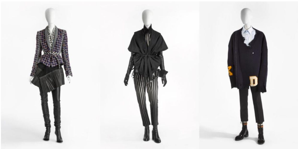
Van links naar rechts: werk van Haider Ackermann, Ann Demeulemeester & Raf Simons