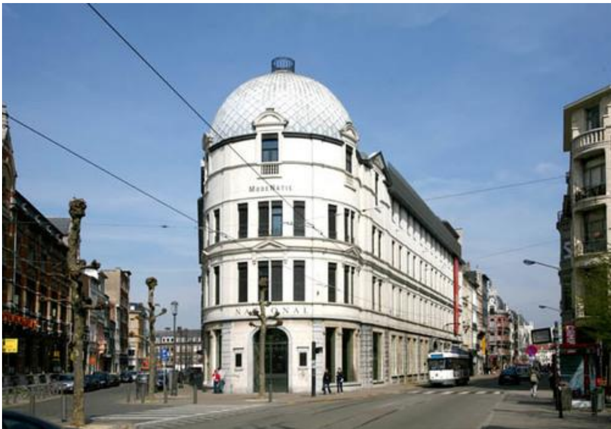
Vooraanzicht ModeNatie

MoMu opende in het historische gebouw van de ModeNatie in de Nationalestraat te Antwerpen. In de 19de eeuw heette de Nationalestraat nog Boeksteeg, en de Drukkerijstraat kende men als de Voddenstraat. De Boeksteeg, één van de langste straten van Antwerpen, liep vanaf de Ijzerenwaag tot aan de Kronenburgstraat, waarachter zich een net van lanen en steegjes bevond.