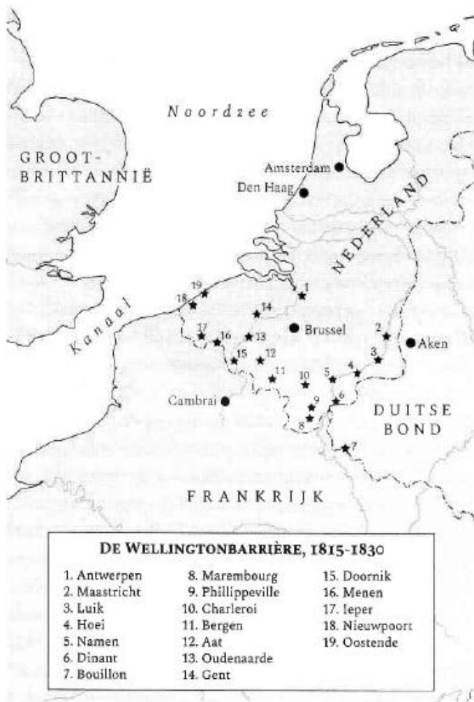
De Wellingtonbarrière op het grondgebied van het Verenigd Koninkrijk der Nederlanden (Tegen de terreur, p. 314)

speciaal fonds met bijdragen uit verschillende landen werden de kosten van dit monsterproject in hoofdzaak gedragen door het Nederlandse koninkrijk. In 1816 merkte Wellington in dit verband overigens laconiek op aan Willem I: 'Qu'on ferme les yeux, et qu'on ouvre la bourse' . Tijdens de Tweede Vrede van Parijs (1815) werd beslist om 21 steden deels of volledig te fortificeren. Hiervan lagen er 19 op Belgisch grondgebied (Oudenaarde, Dendermonde, Gent, Ieper, Menen, Oostende, Antwerpen, Nieuwpoort, Doornik, Aat, Bergen, Charleroi, Namen, Hoei, Luik, Philippeville, Dinant, Mariembourg en Bouillon). In de praktijk kreeg Groot-Brittannië in