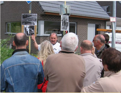
De Boelwandeling

Voor de Boelwandeling schreven ongeveer 80 mensen in. De brochure is intussen opgenomen in het toeristisch aanbod van Temse.