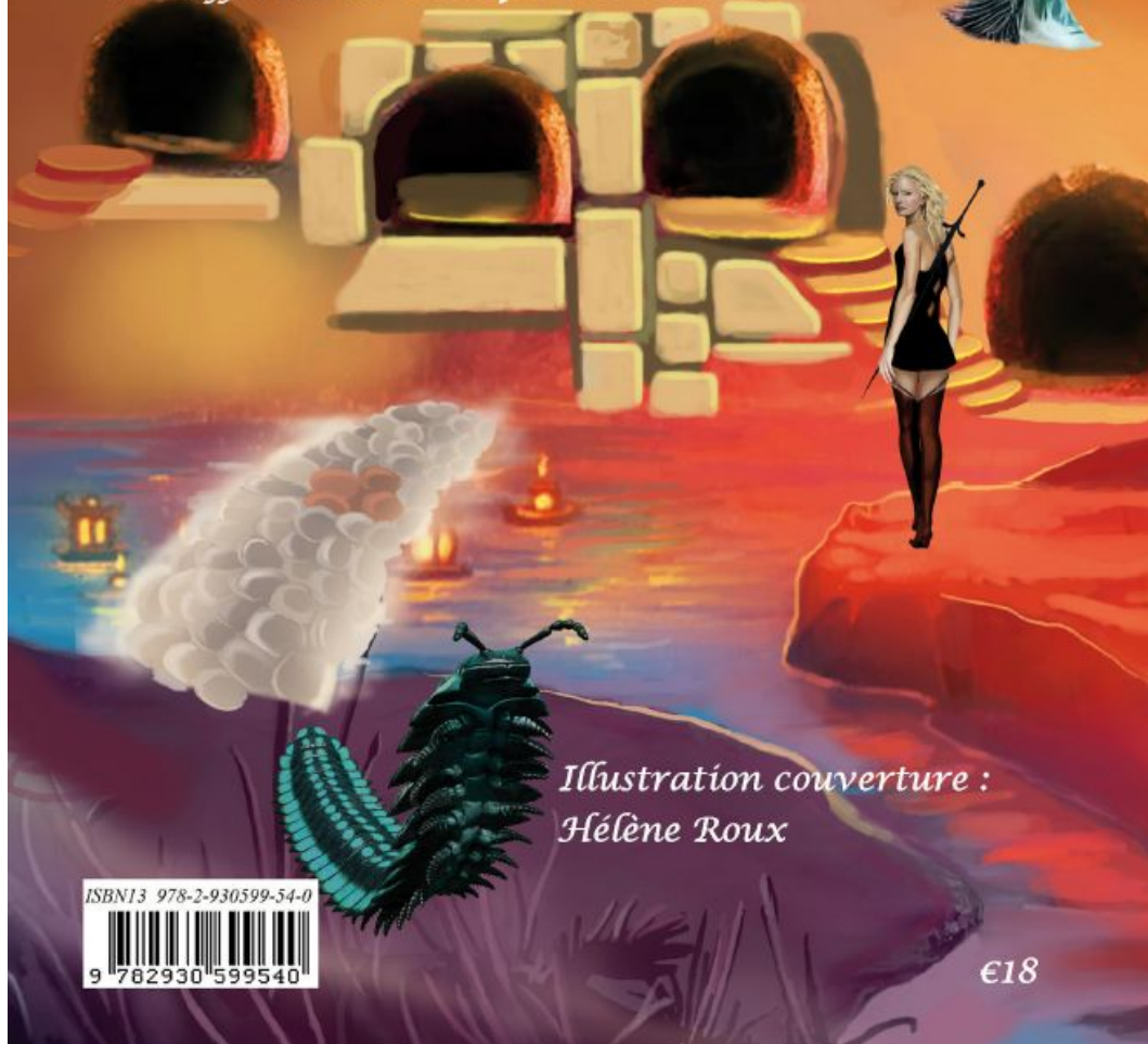
Illustration couverture : Hélène Roux