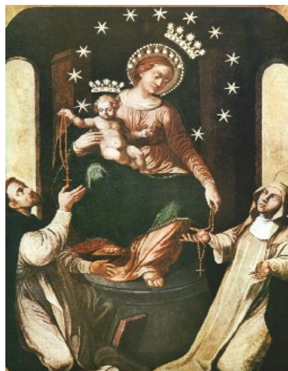
Onze-Lieve-Vrouw van de Rozenkrans Pomei

evangelische mensen op deze manier zonder vooroordelen erkennen en herontdekken wat de rozenkrans biedt, het dan goed zal komen. Maar we moeten er wel aan werken."