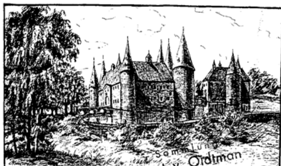
Sürzenich, die ehemalige Burg.