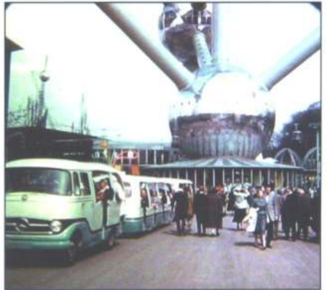
.....of zich laten vervoeren met deze "trein".