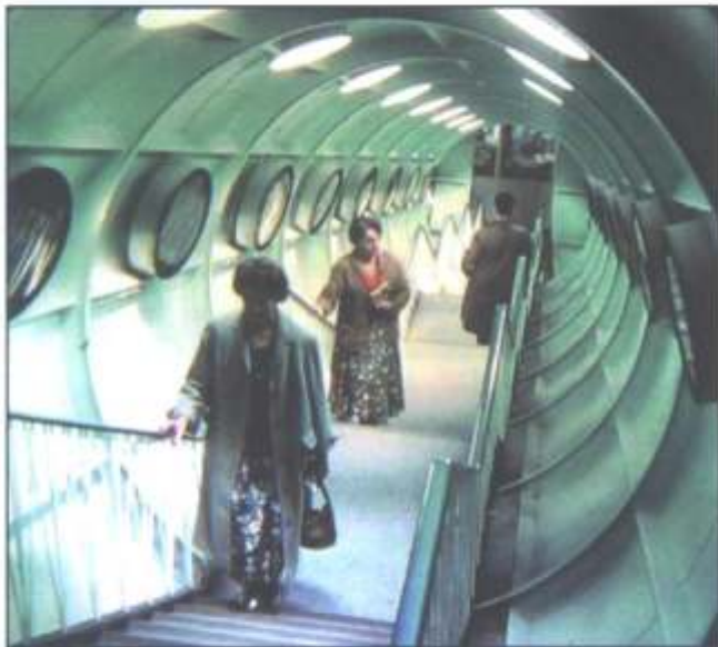
Na een flinke klim door de buizen.....