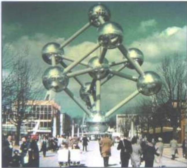
Men kon naar het Atomium lopen.....