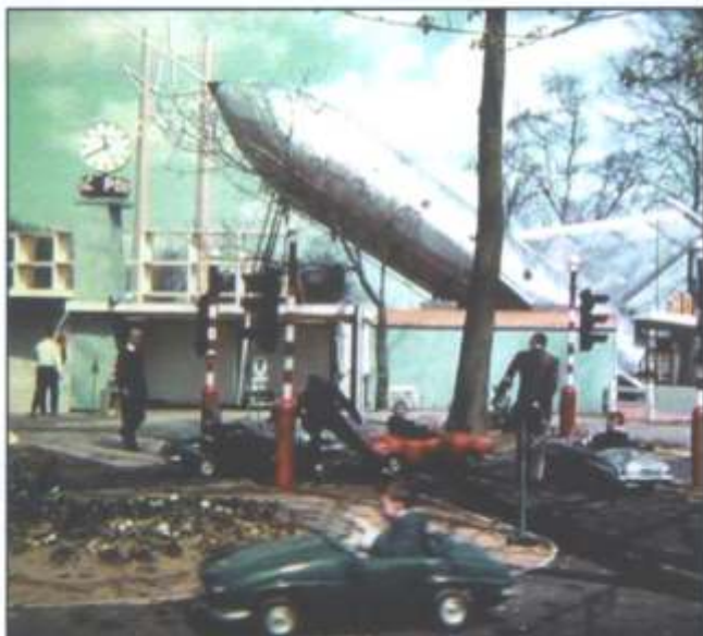
Buiten was er ook genoeg te doen voor de kleintjes.....