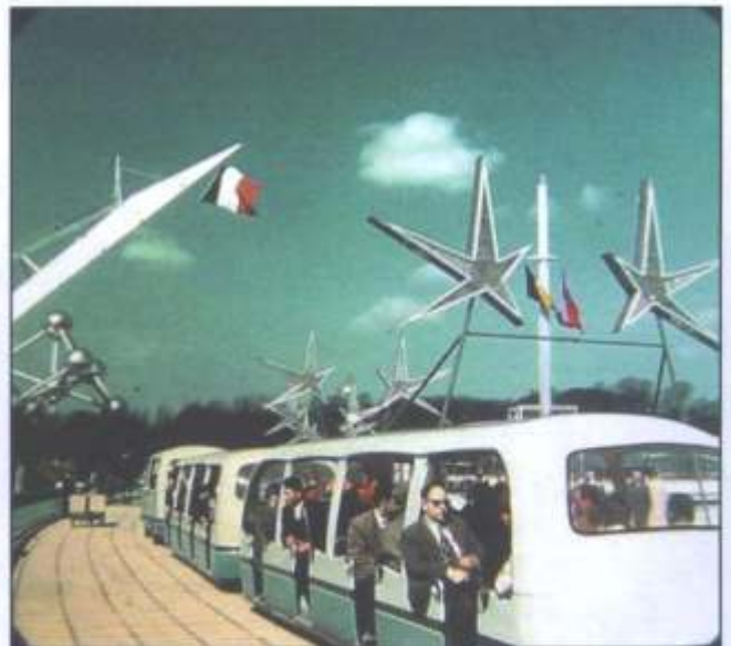
.....en kon men even rusten tijdens een rondrit.