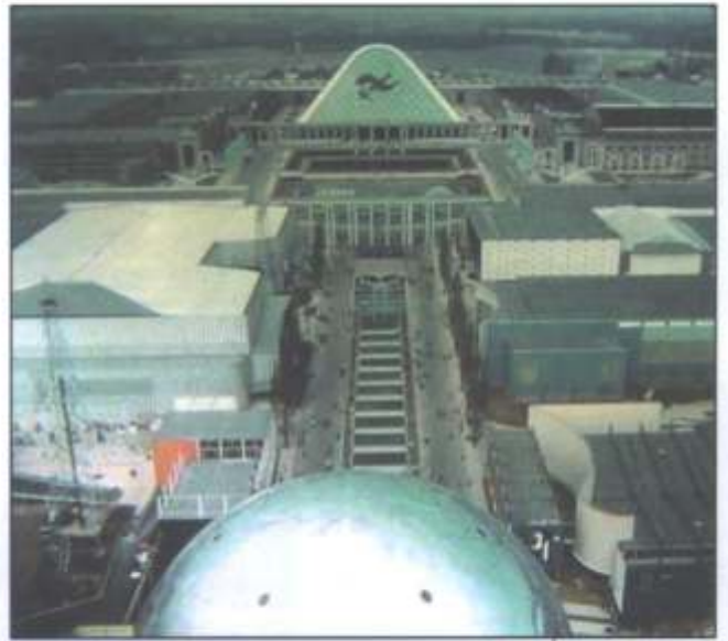
.....had men een prachtig uitzicht over de "Expo".