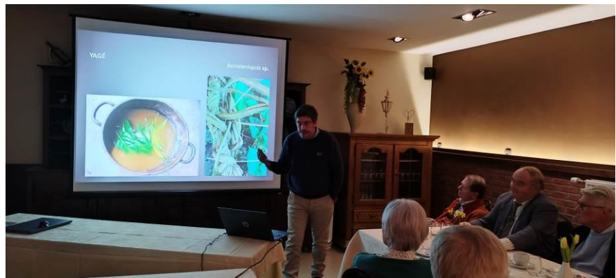
Nicole a présenté et remercié notre conférencier