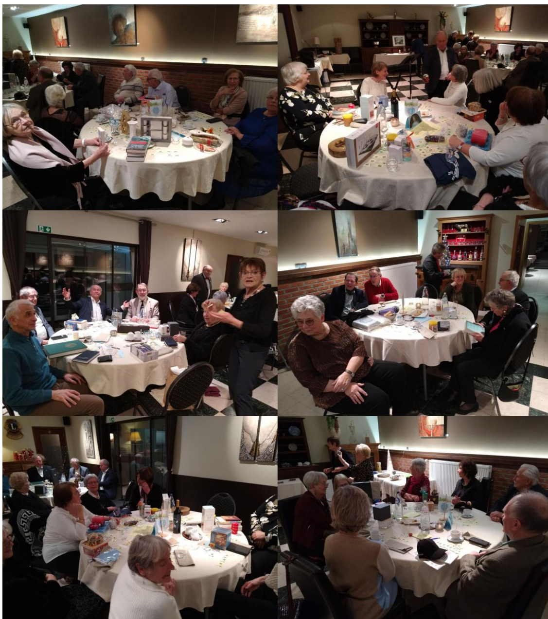
Les lots de la tombola s'accumulent sur les tables