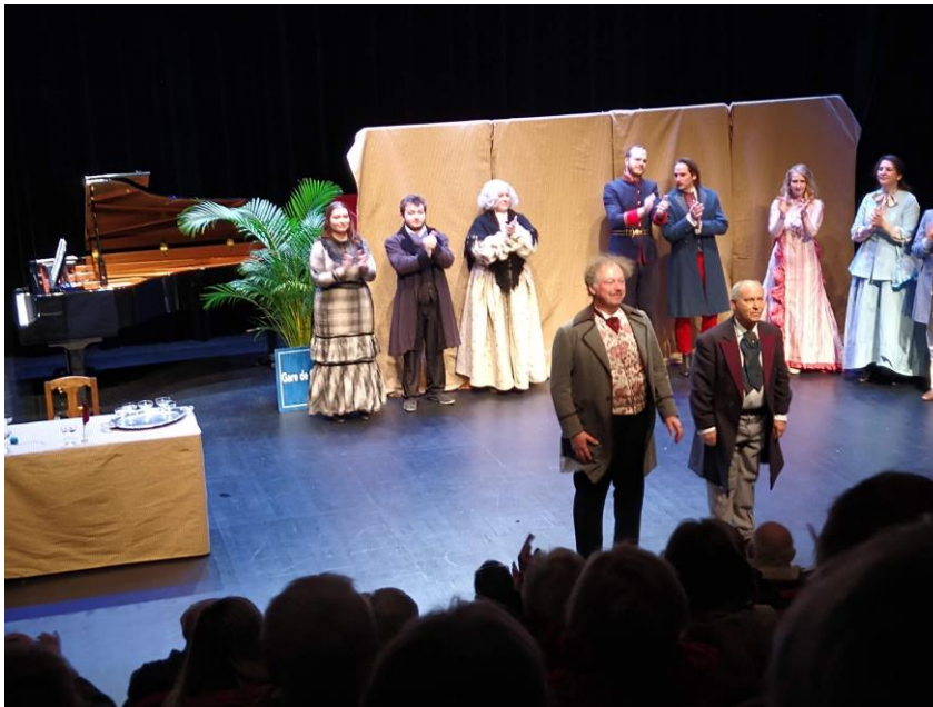
Sous les applaudissements