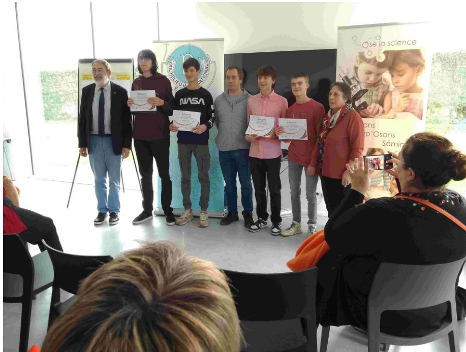
Les 4 lauréats entourés par les organisateurs