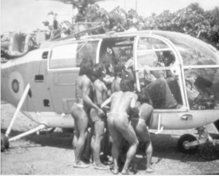
Toerisme bij inheemse volken: soms gewelddadige botsing tussen twee culturen