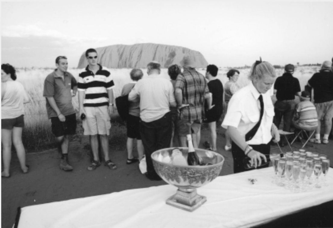
Heilige plaatsen worden gebanaliseerd als toeristische kijkplaatjes : hier Uluru van de Mutitjulu gAboriginal gemeenschap of Ayers Rock voor de toeristen.

Daarnaast is ontbossing een groot probleem, omdat men nog steeds op hout kookt. "Het meenemen van gas of kerosine is zwaar als je naar boven loopt. Er zouden dus alternatieve energiebronnen gevonden moeten worden" aldus Basantha. Ook signaleert hij de invloed van de westerse waarden op de inheemse volken : "Het dorpje Namchibisjov was een klein traditioneel dorp met voornamelijk Sherpa's. Inmiddels heeft het dorp 24 uur per dag electriciteit dankzij een hydro-elektrische dam. De eetgewoonten, de kleding en het leven van de bewoners zijn