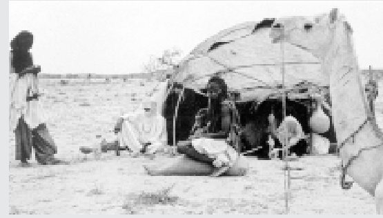
foto: Imradfamilie voor hun tent