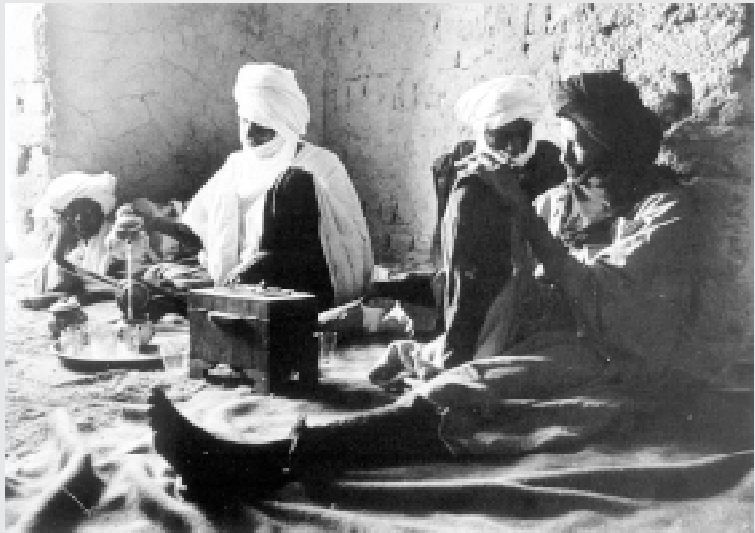
foto: theeceremonie bij de Tuareg