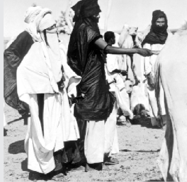
foto: Tuareg op de kamelenmarkt in In-Gall

In de Sahel, waar jaarlijks tussen de 100 en 350 mm regen valt, bestaat het landschap uit doornige bomen, heesters en droogte bestendig gras. De West-Afrikaanse Sahel is echter één van de belangrijkste veeteelt gebieden in Afrika. Het is dan ook vanuit ecologisch en economisch standpunt onbegrijpelijk dat de nomaden het leven zuur wordt gemaakt, terwijl hun producten zo belangrijk zijn voor het overleven van de bevolking.