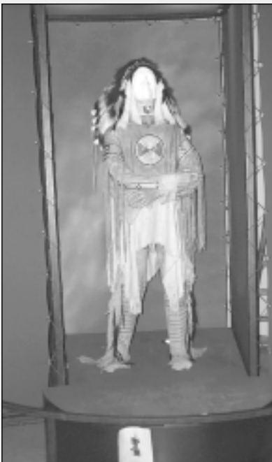
De stereotiepen doorbreken?

zeggen dat de verspreiding van epidemieën 'per ongeluk' gebeurde. Men gaat voorbij aan het feit dat de koloniatoren wel degelijk gebruik maakten van de ontvankelijkheid van de autochtone bevolking voor deze ziekten om met een nieuwe methode van massavernietiging te starten: de verspreiding van geïnfecteerde dekens bijvoorbeeld. Er is genoeg documentatie over het bijna meteen uitbreken van epidemieën in indiaanse dorpen na het uitdelen van dekens door het leger. Hierover is meer diepgaand onderzoek nodig. En volgens mij bestaat er genoeg geschreven bewijsmateriaal (bvb. de correspondentie uit het jaar 1763 tussen Sir Jeffrey Amherst, commandant van het Britse leger, en kolonel Henry Bouquet over de uitroeiing van Odawa, Mingo, Lenape en Shawnee met behulp van geïnfecteerde dekens).