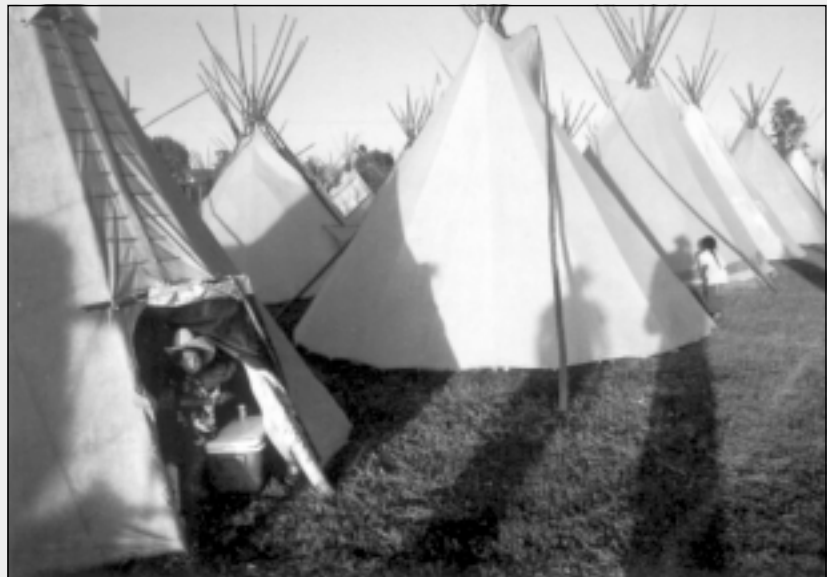
Kinderen spelen in een dorp van 250 Shoshone-tipi's, opgezet ter gelegenheid van het jaarlijkse Pendleton round-up in Pendleton, Oregon

Er is dus zowel goud binnen als buiten het park bijgekomen. Het is een stap voorwaarts in de goede richting, waarbij er niet alleen een basis is gelegd voor permanente toekenning van gronden aan de Timbisha Shoshone. Vooral belangrijk is het feit dat een gedeelte van dit land zich bevindt in het traditionele thuisland, waar de stam zich blijvend kan installeren op een zelfvoorzienende, duurzame en spirituele manier.