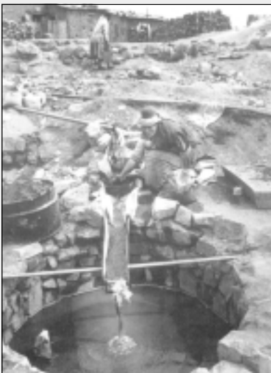
Vrouwen zoeken naar resten tinerts in afvalberg van tinmijn

Vanaf de jaren negentig vonden vissers echter grote aantallen dode vissen in het Poopó-meer. De vissen begonnen ook misvormingen te vertonen en men stelde een verkleining van de soort vast, zodanig dat men zich zelfs verplicht zag de openingen in hun netten te verkleinen. De degradatie van de visserij heeft uiteraard zware gevolgen voor de Urus en Aymara's. De oorzaak van het teniet gaan van het visbestand is te wijten aan de afvallozing door de mijnbouw. Het afvalwater van meer dan 120 lood-, tin- en goudmijnen komt rechtstreeks terecht in het Poopó-meer. Daarnaast komt nog de erosie van de mineraalresten in de mijngangen. Goudexploitatie gebeurt in open lucht en men gebruikt hiervoor zeer toxische stoffen zoals kwik en cyaanzout. De geslotenheid van het meer maakt bovendien dat al die zware metalen in het meer opgestapeld blijven, zodat het water in het meer een uitzonderlijk hoge concentratie aan zware metalen bevat. Ook in de vis zelf zitten zeer hoge concentraties aan zware metalen waardoor deze totaal ongeschikt is voor consumptie. De vervuiling legt zo een zware hypotheek op de voedselveiligheid van de omwonenden. Het feit dat de vis van het Poopó-meer door duizenden mensen werd geconsumeerd, toont de ernst van de zaak.