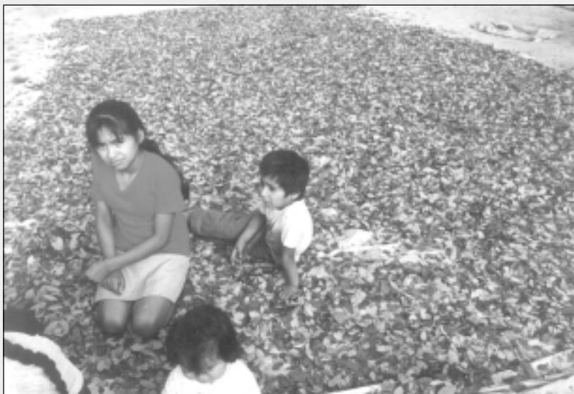
Kinderen op een bed van cocabladeren

Tot op vandaag botsen beide denkwerelden. De internationale gemeenschap wil coca de wereld uit helpen, tenminste dat deel dat voor de illegale cocaïnemarkt is bestemd. De productie voor de traditionale consumptie van de lokale bevolking mag blijven bestaan. Dus, iedereen tevreden zou je denken? De problemen liggen echter dieper. Armoede zet boeren in de Andes er toe aan coca voor de illegale markt te telen. Het argument dat coca deel uitmaakt van de cultuur duikt ook bij deze (illegale) activiteit op. Immers, waarom zouden westerlingen een blad moeten bestrijden dat niet alleen gezond en voedzaam is, maar bovendien ook volstrekt onschadelijk? Waarom is niet alleen cocaïne, maar ook het cocablاد verboden, waardoor derivaten als thee en medicinale bereidingen niet uitgevoerd kunnen worden? In Bolivia zorgt de productie van coca voor de illegale markt dagelijks voor heel wat ophef. Behalve de