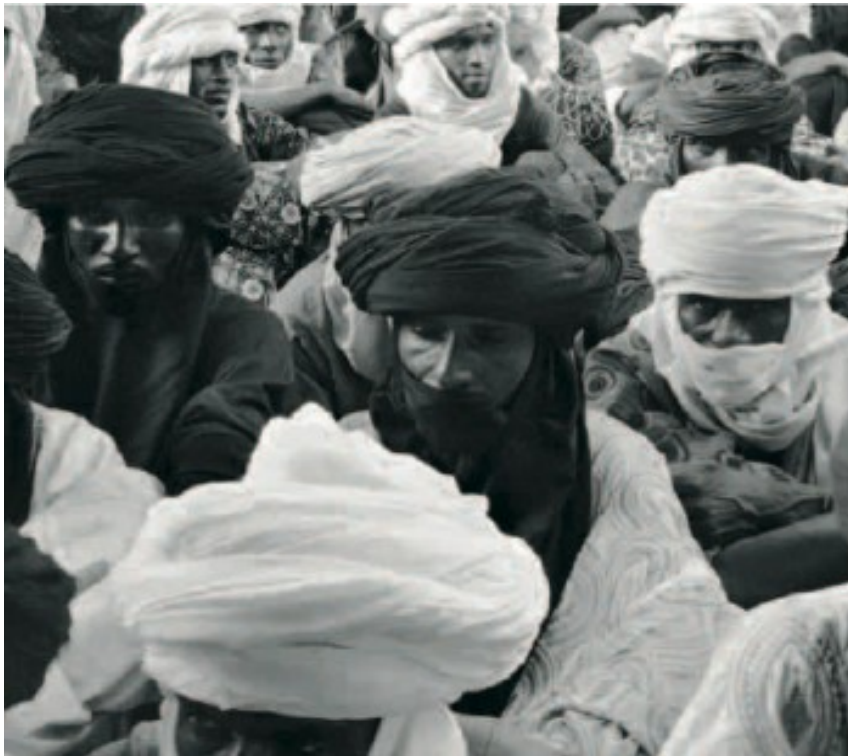
Réunion pendant la deuxième Assemblée Générale, Foudouk, septembre 2005

Situé à près de 80 km au sud-est d'In-Gall, Foudouk est le « centre » des Bingawa, la famille de Doula. Cette fois-ci seize associations s'étaient engagées. Il y avait plus du double de personnes présentes, parmi les-quelles nombre de personnalités : le sultan de l'Aïr, arbitre traditionnel des Touaregs à Agadez, et qui, encore actuellement, a beaucoup d'influence, le ministre nigérien de l'Élevage... L'Unicef vaccinait les enfants contre la rougeole, et un cinéma ambulant mettait en garde, au moyen d'images, contre les dangers du sida. Après une seule édition, l'Assemblée était devenu un événement qu'on ne pouvait plus ignorer. Avec la fondation du collectif début mars, la continuation est assurée.