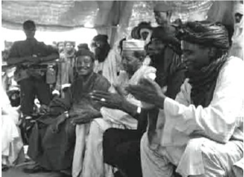
Réunion, Foudouk, septembre 2005. Les militaires sont toujours présents au Niger pendant les grandes assemblées.

but, le plus souvent, de financier un puits pour une famille précise. En général, il faut payer pour pouvoir abreuver son bétail au puits de quelqu'un d'autre. Il existe aussi au Niger des puits « publics », qui sont accessibles à tous. Mais quand il n'y a pas assez d'eau pour chacun, qui y a droit, et qui n'y a pas droit ? Et qui doit supporter les frais d'entretien ? En période de sécheresse, cela engendre facilement des conflits.