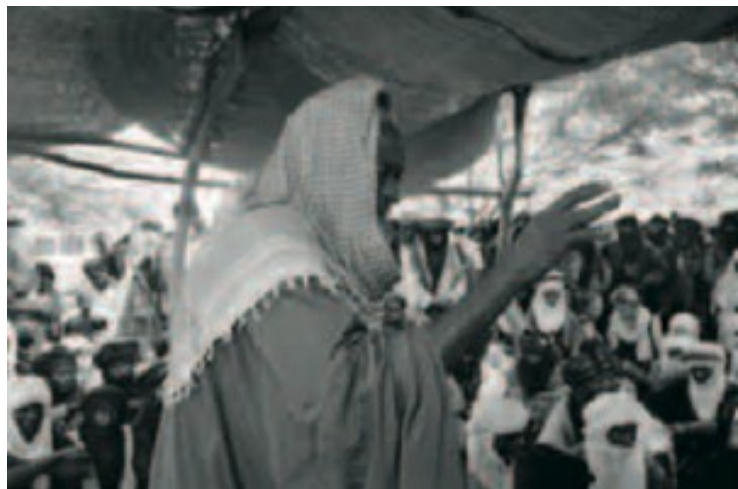
Discours pendant la deuxième Assemblée Générale, Foudouk, septembre 2005