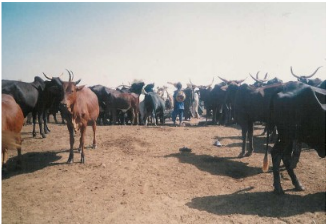
L'eau est rare et chère dans le Sahel. Ceux qui n'ont pas leur propre puits doivent souvent payer pour abreuver leurs animaux. Ce puits ("bundu Allala", bundu = puits) appartient à un groupement de Wodaabé.