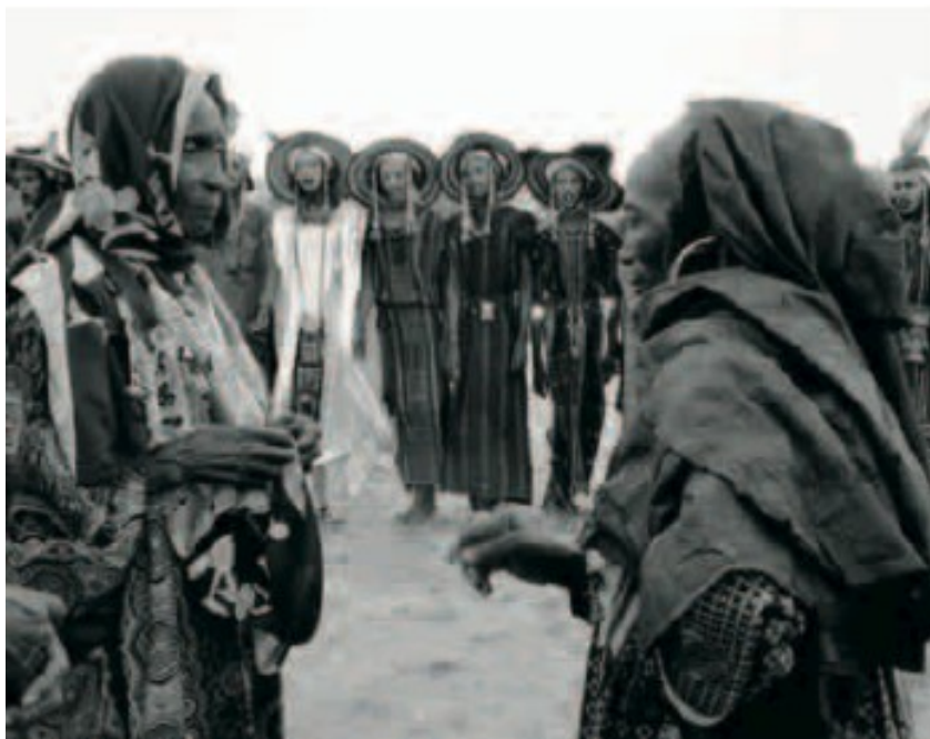
Les vieilles femmes commentent librement les danseurs. Foudouk, sept. 2005

L'automne dernier, la fête officielle de la Cure Salée était à l'origine prévue pour le 10 septembre à In-Gall. A mon arrivée, il parut que le gouvernement avait reculé la date au ... 22 septembre, justement la date du début de la réunion des Wodaabé. "Ils n'ont qu'à remettre leur fête à la semaine d'après". Doula fut même menacé d'emprisonnement si cela ne se passait pas ainsi. Mais il n'était plus possible de remettre à plus tard. Les préparatifs étaient en cours depuis toute une année; un grand nombre d'hôtes nationaux et étrangers avaient mis la