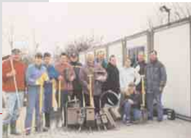
Natuurwerken op de Hoge Dijken, samen met de school Ter Streepe.

Om lid te worden van de v.z.w. 'Vriendenkring van de Hoge Dijken' wordt een jaarlijkse bijdrage van 200 Bef. gevraagd, te storten op rekeningnummer 068-2055083-68. Ieder lid ontvangt driemaandelijkse 'ZANDKORRELS', een natuur- en milieutijdschrift regio Middenkust.