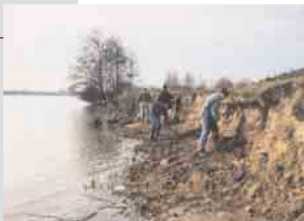
Vrijmaken en afgraven zandberm voor woonst oeverwaluw.