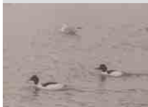
GROTE ZAAGBEK: Het paradepaardje van de 'Hoge Dijken'. Duikt en zwemt zeer behendig en krachtig. Broedt in holen bij visrijke wateren (=vis-eter). Doortrekker en wintergast. Verschijnt bij ons vanaf begin oktober en de laatste verdwijnen in de loop van de maand mei. Was de eerste zeldzame watervogel waargenomen aan de Hoge Dijken.