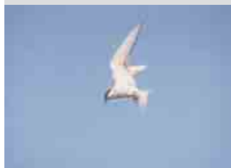
VISDIEFJE: Slanke vogel met in de zomer zwarte kopkap, orangerode snavel met zwarte punt en rode poten. Zomervogel, talrijke broedvogel, doortrekker in groot aantal. Regelmatig bij ons te zien tot eind oktober.