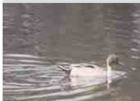
PIJLSTAART: Slanke zwemeend met lange hals en snavel, spitse staart. Veel te zien in ondiep water, schaarse broedvogel, doortrekker en wintergast. Regelmatig te zien bij ons vanaf september.