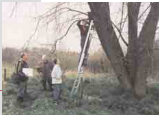
Plaatsen van nestkastjes