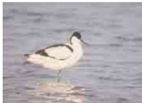
KLUUT: Sierlijke vogel met lange omhooggebogen snavel en lange blauwgrijze poten. Foerageert met zijwaarts maaierende snavel. Onregelmatige broedvogel en jaarlijkse zomergast aan de Hoge Dijken.

Gedurende ruim 15 jaar vogelobservaties zijn in totaal meer dan 200 verschillende vogelsoorten waargenomen.