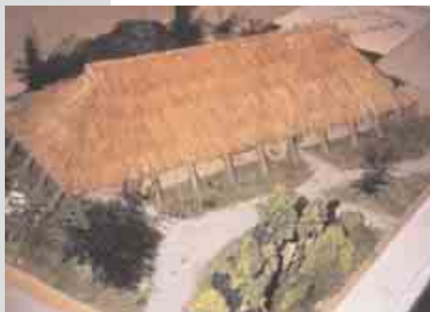
Reconstructie van het woonstalhuis (ontwerp en realisatie Y. Hollevoet).

De vondsten gedaan op de Roksempuut zijn van zeer groot belang voor onze kennis van de vroege middeleeuwen. Toen grensde de streek aan een uitgestrekt overstromingsgebied dat doorsneden werd door kreken en geulen. Op een zandrug bevonden zich de ruïnes van het laat Romeinse stenen castellum ; deze zullen ongetwijfeld een grote aantrekkingskracht hebben uitgeoefend. In elk geval blijkt meer en meer dat tijdens deze troebele periode het gebied heel wat intenser bewoond was dan aanvankelijk gedacht. Reeds tussen de twee wereldoorlogen werd bij zandwinningwerken op de Hoge Dijken in Zerkegem een nagenoeg volledige Merovingische pot aangetroffen.