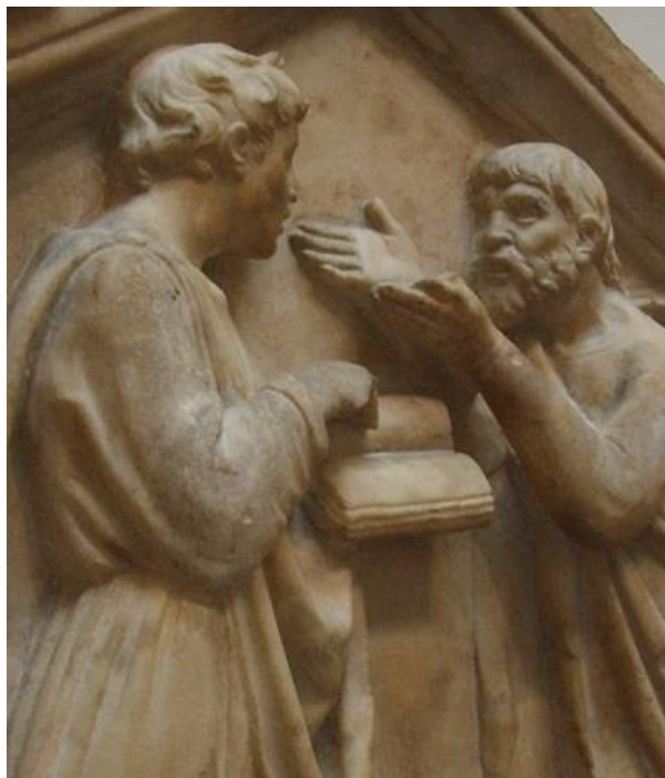
Platon et Aristote discutant - della Robbia (XVe siècle, Florence)

Je reste donc attentif à les repérer, à les mettre en lumière et, quand cela m'apparaît judicieux, à les désactiver.