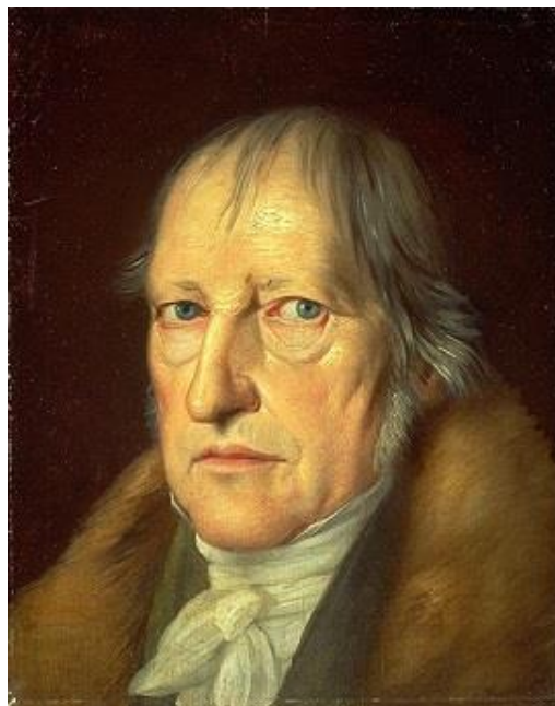
Hegel - Portrait par Schlesinger (1831)

Ce cours de philosophie du droit m'a également définitivement acquis à l'idée du " processus ou raisonnement dialectique ". Il m'a ouvert l'esprit à une vision des activités et entreprises humaines dans laquelle une Thèse se voit inéluctablement opposée à une Antithèse , les deux évoluant vers une Synthèse ; ... devenant une nouvelle Thèse s'opposant à une Antithèse , les deux évoluant vers une nouvelle Synthèse ; cette dernière devenant une nouvelle ... et ainsi de suite.