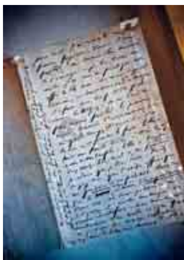
Hugo maakte ook opstaande aantekeningen in de kantlijnen.

Victor Hugo was een hormonale schrijver die bij vrouwen moest bekomen van zijn literaire inspanningen